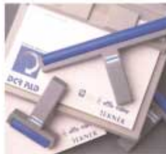
DCR Reinigungsblocks, Roller und Ersatz-Blocks